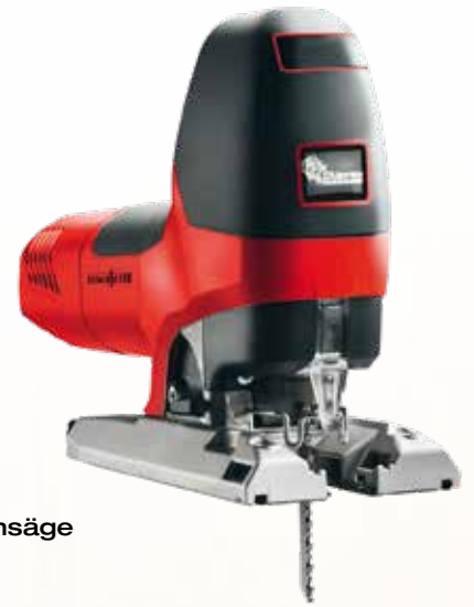
Präzisionsstichsäge P1 cc MaxiMAX im T-MAX Art.Nr. 917103